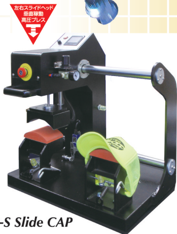
AP-S Slide CAP