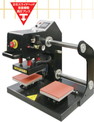
AP-S Slide CHEST