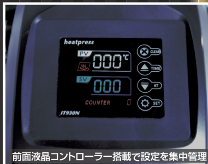
前面液晶コントローラー搭載で設定を集中管理