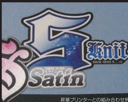
昇華プリンターとの組み合わせ例